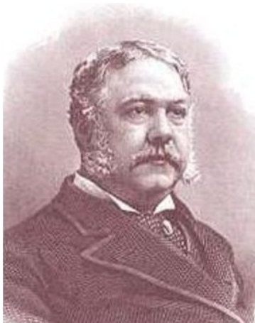
วิลเลียม อาร์เธอร์ วอร์ด (William Arthur Ward)

“คนคิดลบ พร่ำบ่นเกี่ยวกับลม คนคิดบวก ภาวนาให้ลม เปลี่ยนทิศ...คนที่อยู่กับความ จริง ปรับใบเรือ”